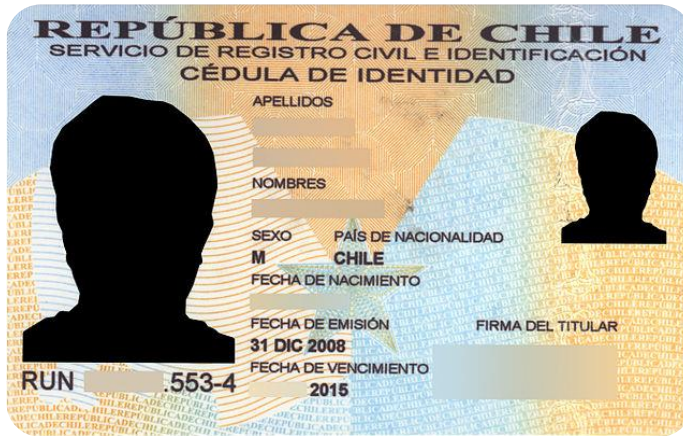
Presidente de la organización.

La copia del documento debe ser por ambos lados.