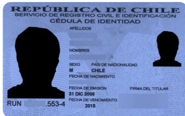
Secretaria(o) de la organización